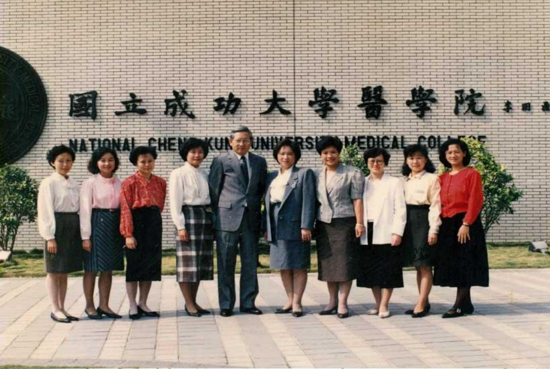
七十八學年度護理學系全體教職員