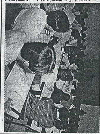
△成大「台語現代文」吸引病室學生前往上課。