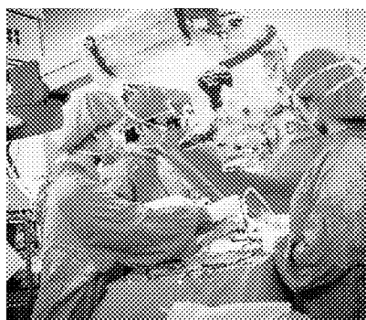
培養急重難罕照護能力