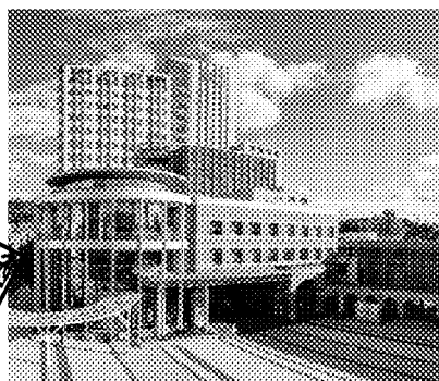
鏈結北醫大校院資源