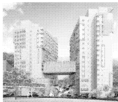
生醫園區培養創新人才